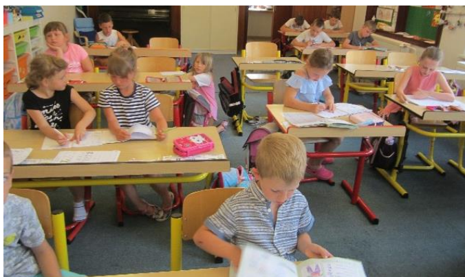
Učebna v zasedací místnosti OÚ

Školní rok byl ukončen mimořádně dříve, a to 26. června. Bylo třeba „sbalit školu“ v náhradních prostorách na obecním úřadě, abychom počátkem července mohli zahájit stěhování do opravené školní budovy. Zaměstnanci školy místo nástupu na dovolenou na zotavenou uklidili celou novou školní budovu, aby mohlo začít stěhování. Velice při stěhování pomáhali dobrovolníci z řad rodičů žáků, lažánečtí sportovci i obecní zastupitelé. Přípravný týden byl zahájen již 20. srpna, abychom zařizování nové školy v klidu dokončili. Děkuji všem, kteří aktivně přiložili ruku k dílu, zejména zaměstnancům školy. Zvláštní poděkování patří Stolařství Brandštetter, které intenzívně pomáhalo po dobu letních prázdnin i během podzimu.