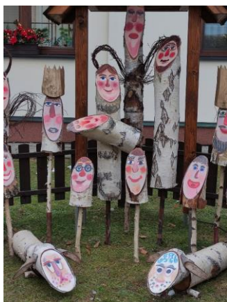
Školní březový betlém

Doufejme, že rok 2022 nám přinese klidnější dobu bez zásadních změn, abychom se mohli plně soustředit na výchovu a vzdělávání našich žáků.