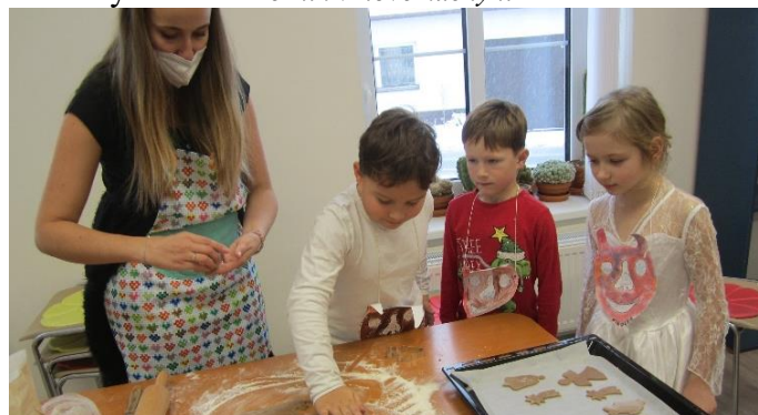
Perník v nové kuchyni

Tento podzim jsme měli v plánu uspořádat pravidelné školní akce jako např. svatomartinský lampionový průvod. Od konání jsme nakonec upustili z důvodu bezpečnosti žáků v době koronavirové epidemie. Jako kompenzaci jsme ve škole uspořádali o víkendu 13. a 14. listopadu výstavu výtvarných prací, kde naši žáci namalovali legendu o životě svatého Martina. Žáci si také v nové školní kuchyni upekli svatomartinské rohlíčky.