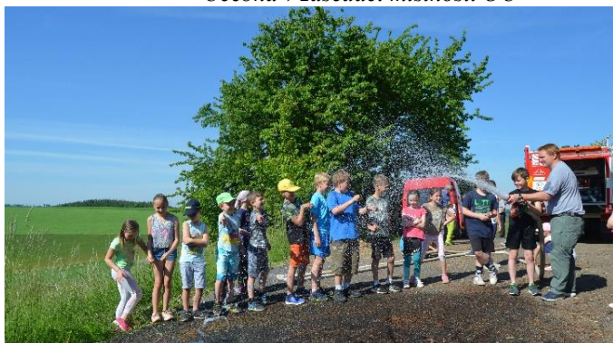
MDD na Horce s hasiči

Prvního září tohoto roku jsme pak slavnostně přivítali naše žáky ve zcela nových, čistých, bezbariérových a moderních prostorách školy. Také rodiče, občané Lažánek a veřejnost měli možnost