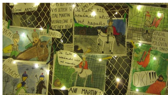
Výstava o svatém Martinovi

podívat se do zrekonstruovaných a nově vybudovaných interiérů školní budovy, a to v sobotu 4. září, kdy byl Den otevřených dveří. Do Základní školy v Lažánkách nastoupilo celkem 45 žáků. V prvním ročníku je 14 žáků, ve druhém 8 žáků, ve třetím 11 žáků, ve čtvrtém 4 žáci a v pátém je 8 žáků. Z toho je 29% přespolních dětí. Mimo vyučování jsou v provozu ranní školní družina a dvě oddělení odpolední družiny. Pravidelnou součástí výuky je opět testování žáků na Covid 19, což nám ubírá čas ve vyučovacích hodinách.