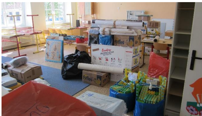
Stěhování do školy

Školní rok byl ukončen mimořádně dříve, a to 26. června. Bylo třeba „sbalit školu“ v náhradních prostorách na obecním úřadě, abychom počátkem července mohli zahájit stěhování do opravené školní budovy. Zaměstnanci školy místo nástupu na dovolenou na zotavenou uklidili celou novou školní budovu, aby mohlo začít stěhování. Velice při stěhování pomáhali dobrovolníci z řad rodičů žáků, lažánečtí sportovci i obecní zastupitelé. Přípravný týden byl zahájen již 20. srpna, abychom zařizování nové školy v klidu dokončili. Děkuji všem, kteří aktivně přiložili ruku k dílu, zejména zaměstnancům školy. Zvláštní poděkování patří Stolařství Brandštetter, které intenzívně pomáhalo po dobu letních prázdnin i během podzimu.